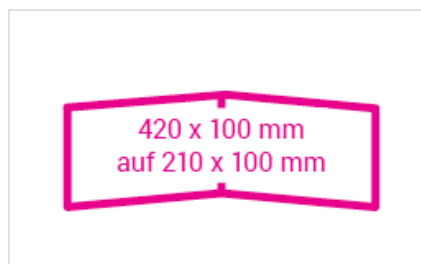
offen: 420 x 100 mm geschlossen: 210 x 100 mm Falzabstände aussen: 210/210 mm Falzabstände innen: 210/210 mm