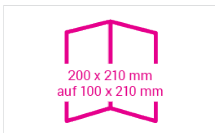
offen: 200 x 210 mm geschlossen: 100 x 210 mm Falzabstände aussen: 100/100 mm Falzabstände innen: 100/100 mm