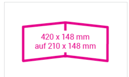
offen: 420 x 148 mm geschlossen: 210 x 148 mm Falzabstände aussen: 210/210 mm Falzabstände innen: 210/210 mm