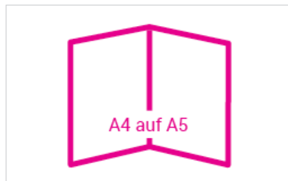
offen: 296 x 210 mm geschlossen: 148 x 210 mm Falzabstände aussen: 148/148 mm Falzabstände innen: 148/148 mm