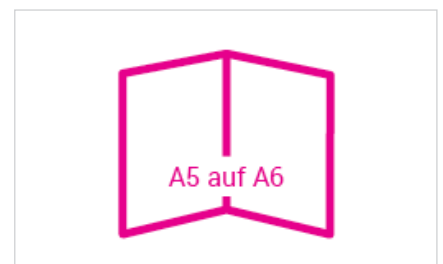
offen: 210 x 148 mm geschlossen: 105 x 148 mm Falzabstände aussen: 105/105 mm Falzabstände innen: 105/105 mm